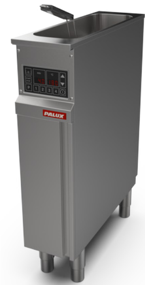
PALUX Fry Star 21 Einbecken-Fritteuse, 200 mm

20 voreingestellte Produkttasten. Gelingsicherheit in der Systemgastronomie.