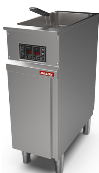
PALUX Fry Star 31 Einbecken-Fritteuse 300 mm