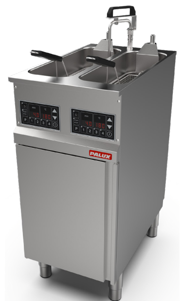
PALUX Fry Star 42 Zweibecken-Fritteuse, 400 mm mit Optionen Pumpe und Korb-Hubvorrichtung