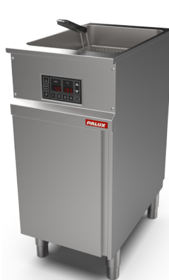
PALUX Fry Star 41 Einbecken-Fritteuse 400 mm